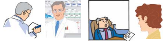
Arzt Apotheke Manager Patient